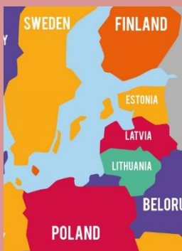
Kaart gemaakt door freepik