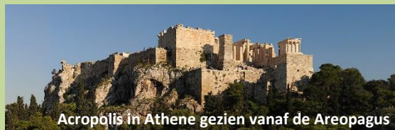
Acropolis in Athene gezien vanaf de Areopagus

Komend seizoen wordt CBS Griekenland achterin ieder Werkboek uitgelicht. Een deel van het wereldwijde internationale werk van CBS.