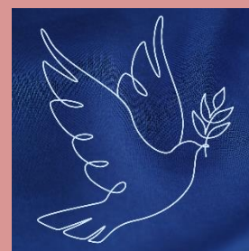
Ontwerp: Femke Kleisen